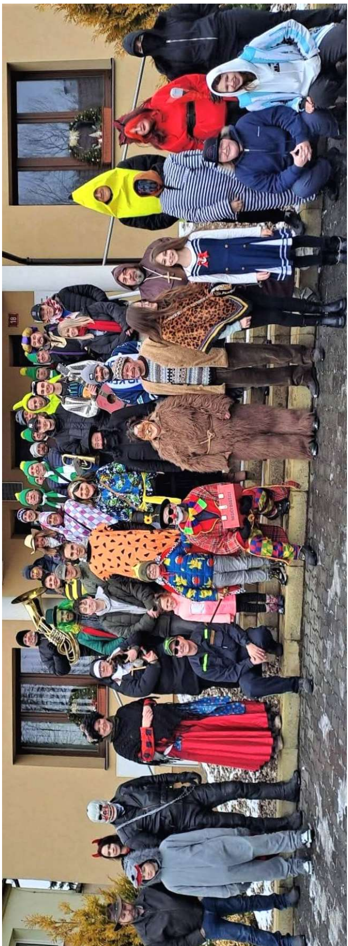
Masopust 31. ledna v Dobšicích