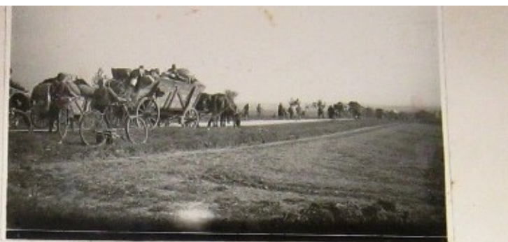
Němečtí uprchlíci utíkají před blížící se frontou přes Žehuň ke Kolínu.

Dne 15. dubna svrhli američtí letci bomby na Velký Osek a na Kolín. Ve V. Oseku bomby spadly na luka, ale v Kolíně bylo zničeno mnoho domů a zabito asi 40 lidí. Dále byly poškozeny některé továrny, elektrárna, silniční most přes Labe a železniční trať. Celé roje letadel přelétaly nad Sány v poledne od jihu k severu každý den.