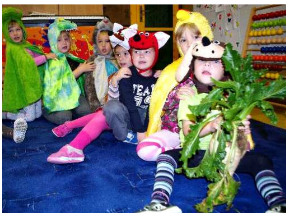
Tahání veliké řepy.

Máme papír, máme tužku, nakreslíme spolu hrušku. Taky švestky, jablíčka, co přivezla tetička.